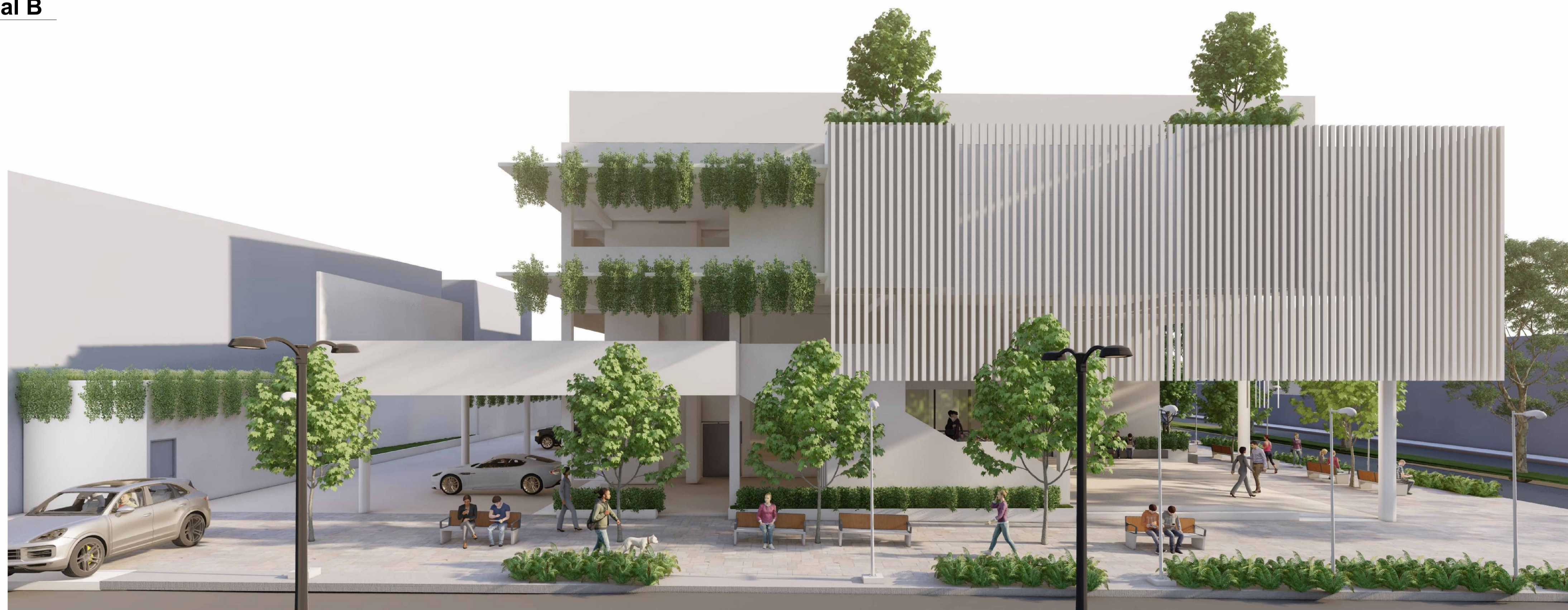
Render 3D Exterior, Calle 27