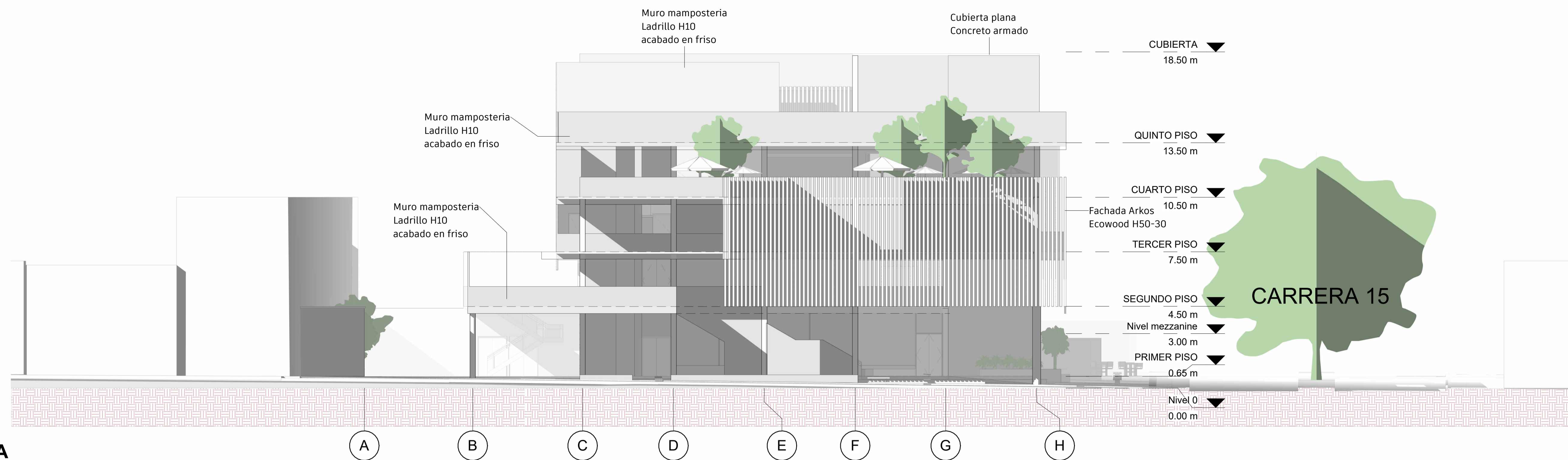
1 Fachada A 1 : 125